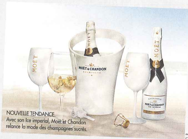
NOUVELLE TENDANCE. Avec son Ice Imperial, Moët et Chandon relance la mode des champagnes sucrés.

La jeunesse aime l'association du froid et du sucré ? Moët & Chandon crée en 2010 pour la génération "soda" Ice Imperial. Un champagne très sucré (dosage : 45 grammes de sucre par litre) à boire avec des glaçons, vendu 35 €. Cette création s'inspire de la mode venue de la nuit, appelée "champagne piscine", et qui revient à mettre de l'eau dans son champagne ! Pour qu'un breuvage glacé ait encore du goût, il faut pousser fort le volume du sucre. Ce qui n'est pas nouveau en Champagne. Les Russes, les plus grands amateurs