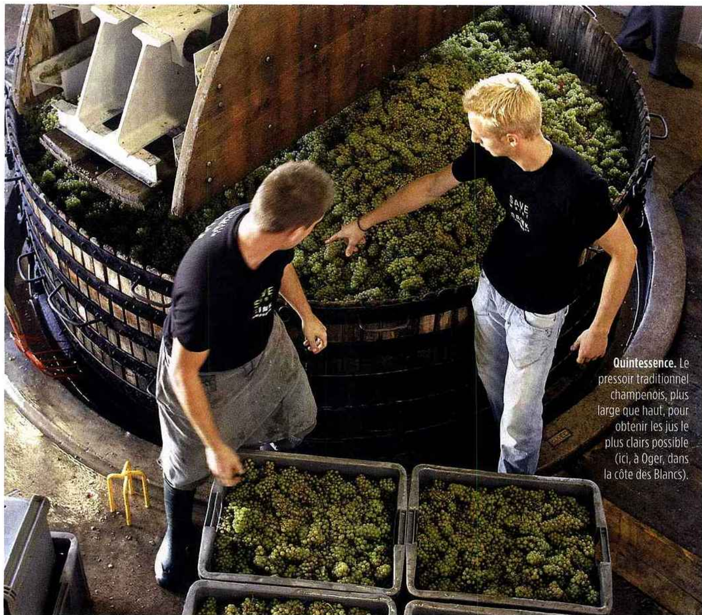
Quintessence. Le pressoir traditionnel champenois, plus large que haut, pour obtenir les jus le plus clairs possible (ici, à Oger, dans la côte des Blancs).